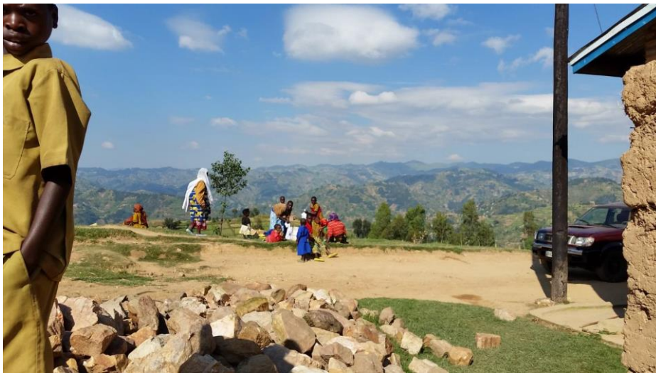
Uitzicht op de heuvels ten noorden van Kabaya. Ongeveer 7 km van het dorp.