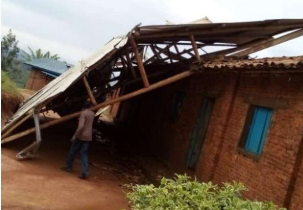
Figuur 3 Door de regenval beschadigde Gaseke school

De schoolgebouwen zijn niet sterk genoeg om de impact van natuurrampen te kunnen verdragen. Het is ook één van de uitdagingen die klimaatverandering met zich meebrengt, vooral voor kwetsbare gemeenschappen van Ngororero. Ouders dienen lang te wachten op de reparatie van de door de regen beschadigde scholen van hun kinderen.