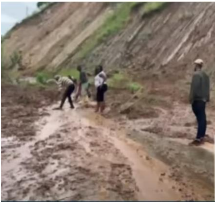
Figuur 2 Weg die helemaal afgesloten werd door aardverschuiving in Ngororero

Wegen werden helemaal afgesloten en 4 scholen werden vernietigd.