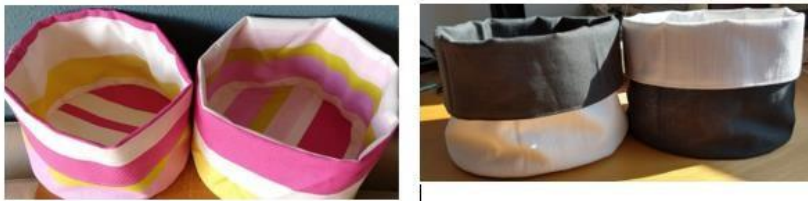
Figuur 8 Te koop broodmandjes

Mevrouw Sien maakt broodmandjes en verkoopt deze. De opbrengst is bestemd voor stichting Jyambere.