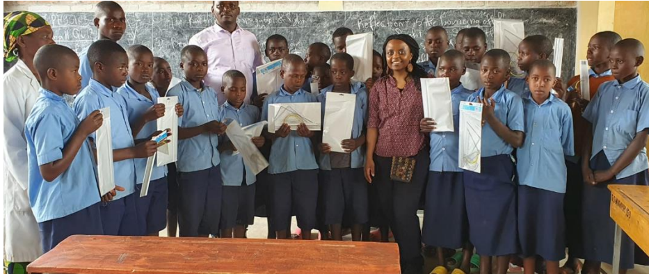
Figuur 6 Kinderen in een klaslokaal met de secretaris en de toezichthouder te Kabaya

In april 2023 heeft de secretaris van Jyambere de kinderen bezocht en heeft elke kind een wiskunde kit gekregen.