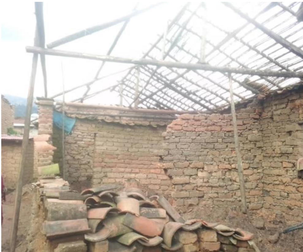
Figuur 4 Huis van het kind van Jyambere J Jeanette Uwajeneza na regenval van mei 2023

In annexure of this message, we attached the caption of photo where the house was destroyed”