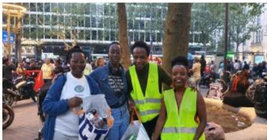
Figuur 9 Inzameling statiegeld

Innocent verzamelt statiegeld flessen en blikjes voor Stichting Jyambere.