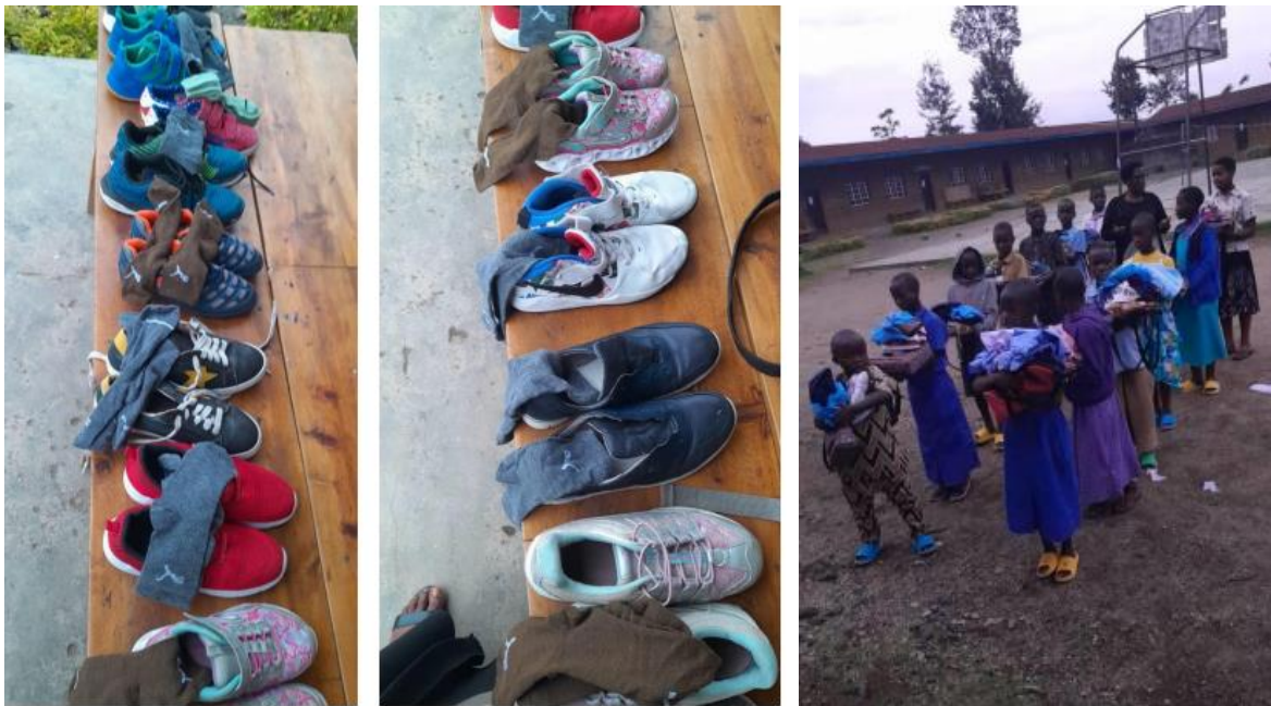
Figuur 7 Gesponsorde kleding in ontvangst nemen

“According to the children supported by Jyambere Foundation for their Mission in the future, their mission are better for reason they received different scholastic materials such as notebooks, pens, shoes, school uniforms and other necessities but there is challenges when the children finished primary education level; many of them case to continue their studies in secondary level because Jyambere Foundation supposed that will stop to support them and they don't have good living standard in their families.”