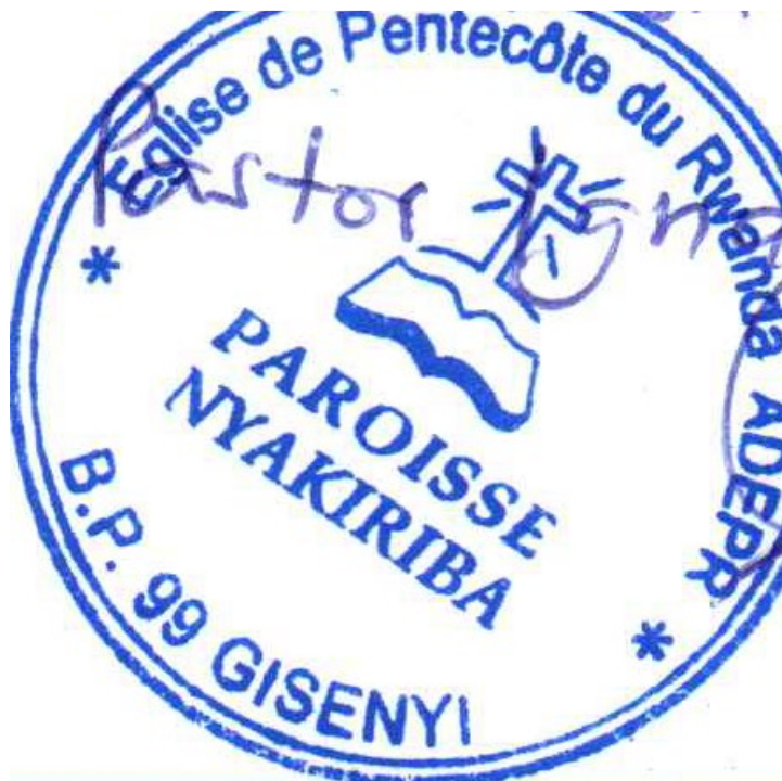
Figuur 3 Nieuwe partner BAHO NEZA van ADEPER

De samenwerking met Caritas verliep volgens onze stichting niet naar wens. Hierdoor hebben wij besloten om de samenwerking na 2017 te stoppen. Ondertussen hebben wij contact gehad met een andere organisatie in Rwanda (BAHO NEZA wat betekent 'goed leven') die graag de taken van Caritas over wilt nemen en toezicht wilt houden op nog een aantal andere kinderen. Dit zal dus betekenen dat de parochie te Kabaya 35 leerlingen onder haar zorg krijgt en BAHO NEZA 22 leerlingen en mogelijk nog met 4 extra kinderen komt.