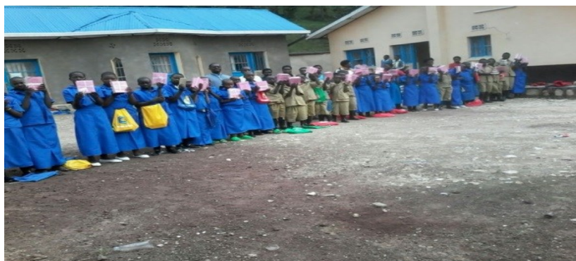
Figuur 2 Overzicht van gesteunde kinderen

Van de 35 kinderen onder het toezicht van de parochie te Kabaya waren er 21 meisjes. Dit is 60,7% van de gesponsorde kinderen. Dit is ook te zien op de foto hieronder.