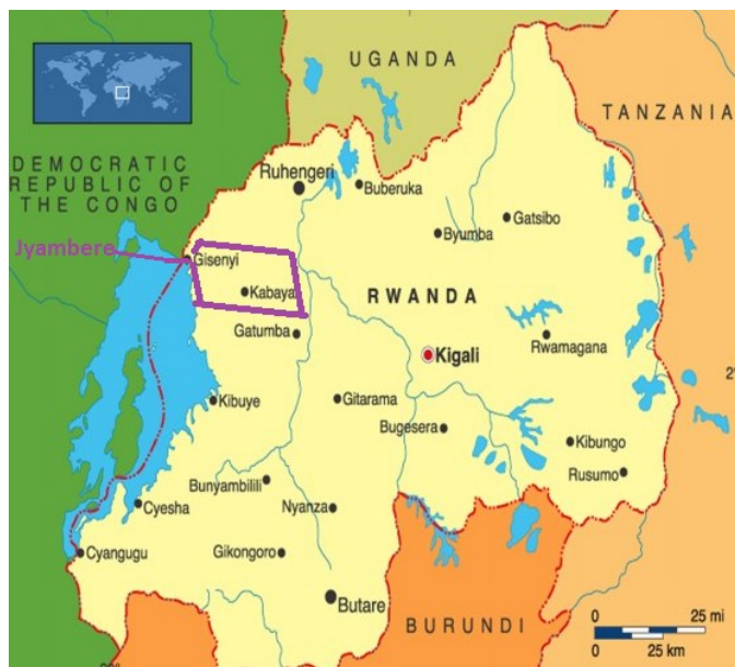
Figuur 1 Werkplaats van Jyambere

De ondersteuning betreft, uniform en schoolmaterialen.